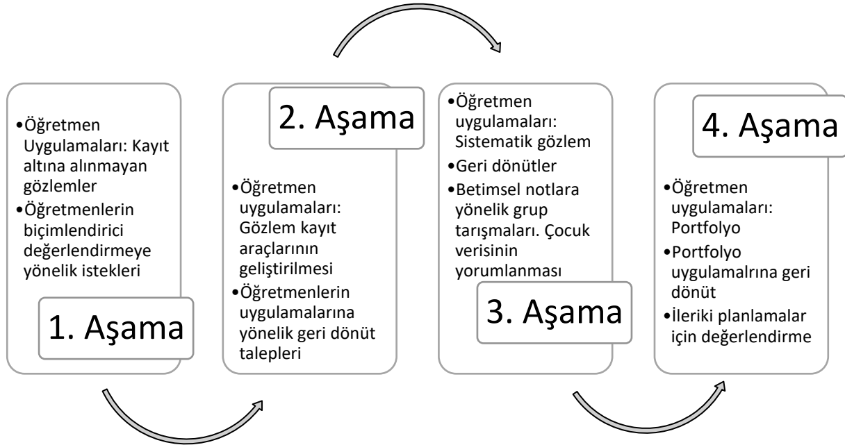
Şekil 1. İşbirlikçi eylem araştırmasının yansıtıcı döngüsü.

Eylem araştırması, planlama, uygulama ve gözlemlenme, yansıtma ve tekrar karar almayı içeren bir yansıtıcı döngüye sahiptir (Kemmis & McTaggart, 2000). Şekil 1, bu çalışmanın yansıtıcı döngüsünü göstermektedir.